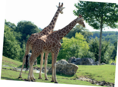
Zoo de Beauval.