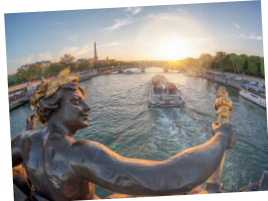
Croisière découverte de Paris.