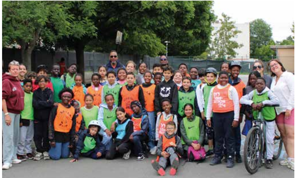
À Langevin, les élèves ont vécu un beau moment de vivre-ensemble.

moments d'échange et de convivialité, avec en point d'orgue une nuit sous tente entre forêt et campagne. Au plus près de la nature. Au-delà de l'effort et des kilomètres parcourus, cette escapade a permis de développer l'autonomie, l'esprit d'équipe et le goût de l'aventure. Loin de leurs repères, deux jours durant. La Ville de Fleury-Mérogis félicite chaleureusement les enfants, les équipes éducatives, les encadrants et les familles qui ont contribué à la réussite de ce beau projet. Malgré la pluie et le froid, rien n'a entamé l'enthousiasme du groupe : c'est avec le sourire que les enfants ont retrouvé leur école, heureux et fiers de cette magnifique escapade. ■