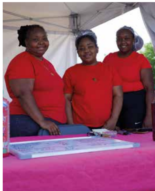
Et aussi Karibbean Union...