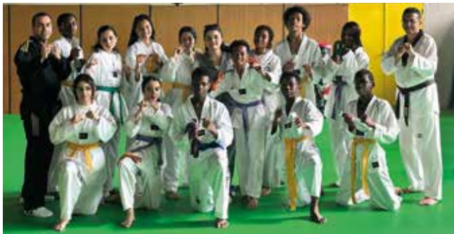
Remise des ceintures pour les taekwondoïstes.

* Rendez-vous le samedi 5 septembre pour la journée des associations (cf. p. 17).