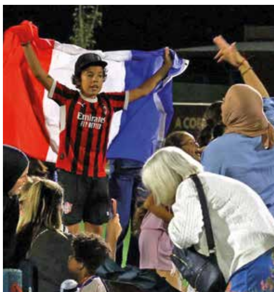
Des Floriacumoises qui ont donné de la voix !

Fan zone comble, supporters au rendez-vous et victoire des Bleus face au Sénégal (3-1) : tous les ingrédients étaient réunis pour une belle soirée sur le terrain Walter-Felder. Merci au public, aux agents municipaux, au FC Fleury 91, à ses partenaires et à tous les acteurs mobilisés pour la réussite de cet événement. La Coupe du monde se poursuit, d'autres événements sont à venir. ■