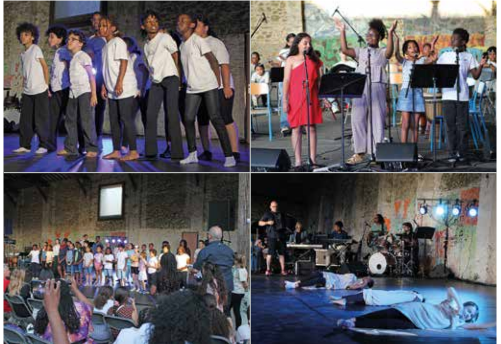
Une prestation époustouflante de la part des élèves et professeurs du CMA.

Les élèves et les professeurs du CMA ont présenté leur spectacle de fin d'année devant leurs parents, leurs amis ainsi que les élus de la ville, notamment Monsieur le Maire. Tous ont été impressionnés par ce concert qui a, une nouvelle fois, mis en lumière le talent des élèves. Danse contemporaine, violon, guitare, djembé, théâtre... sans oublier l'exposition de la classe d'arts plastiques : les disciplines se sont succédé tout