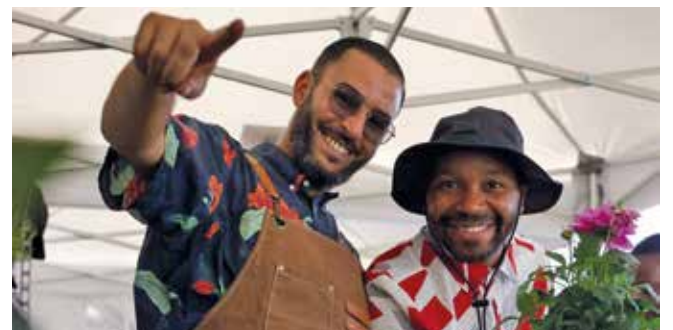
Sans oublier nos valeureux jardiniers !