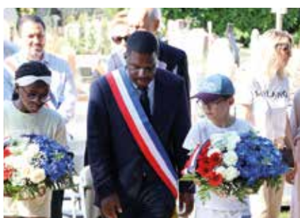
Dépôt de gerbe avec les écoliers.