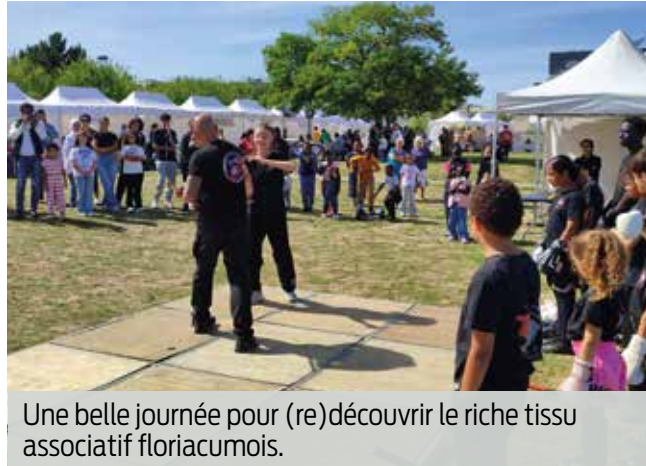
Une belle journée pour (re)découvrir le riche tissu associatif floriacumois.

À la rentrée, venez rencontrer les dizaines d'associations qui fleurissent dans notre ville et leurs bénévoles engagés qui œuvrent tout au long de l'année pour proposer des activités sportives, culturelles, solidaires, de loisirs et de découverte pour tous les âges. Ce premier samedi du mois de septembre, chaque stand, chaque