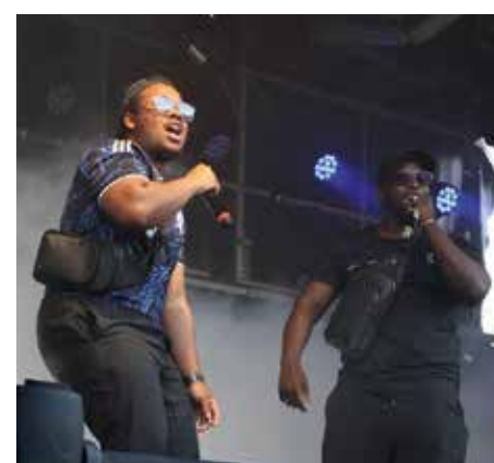
Du rap comme on aime avec MB.