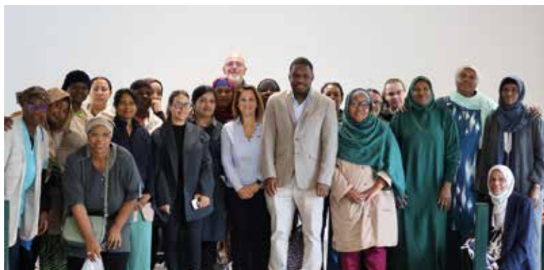
Rencontre avec l'équipe d'agents d'entretien.