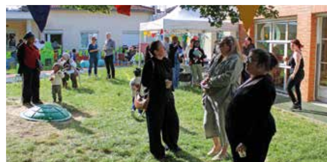
Une belle fête pour les tout-petits et leur famille.

du service Petite enfance ont accueilli parents et tout-petits autour d'une multitude d'activités ludiques et d'ateliers d'éveil. Une page se tourne pour les plus grands qui découvriront la maternelle en septembre. ■