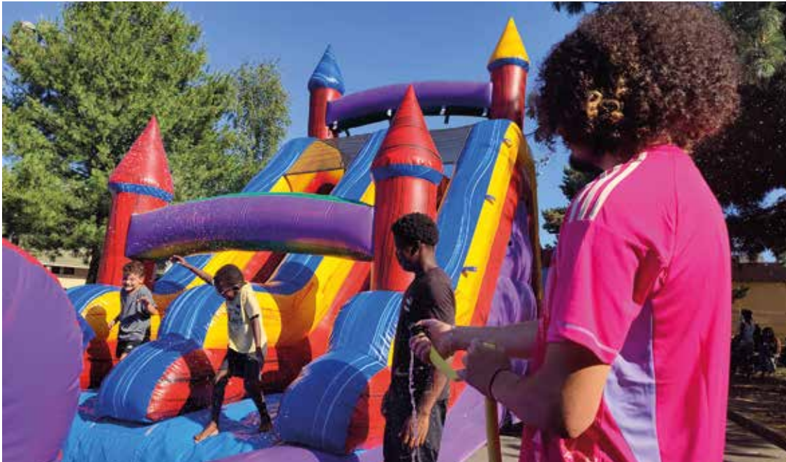
Les structures gonflables feront de nombreux heureux cet été !