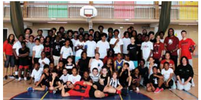
Un beau plateau avec le club Fleury Basket.