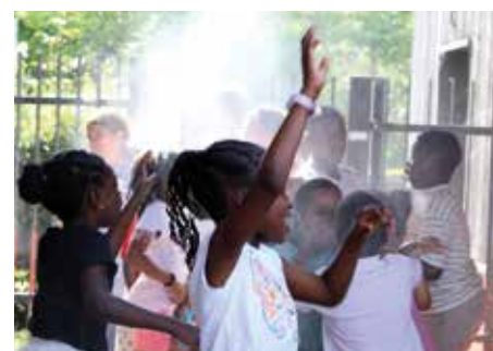
Installation de brumisateurs (ici, Desnos).

À l'écoute de la communauté éducative, la Municipalité s'engage pour ses écoles.