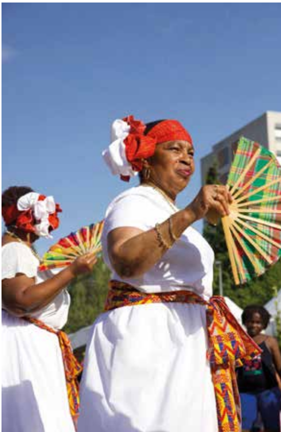
De la danse avec Reflets d'outre-mer.