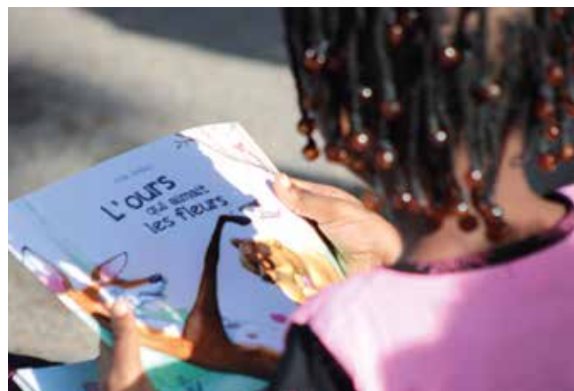
Des enfants impatients de lire leurs livres cet été.

ATSEM, AESH, agents de restauration, agents d'entretien et animateurs, dont l'engagement quotidien contribue au bon fonctionnement des écoles. À cette occasion, les élus ont remis à chaque élève un cadeau «porteur de sens»: des livres afin d'encourager la lecture, ainsi que des