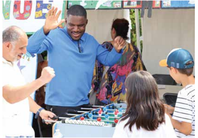
On s'amuse bien avec M. le Maire !