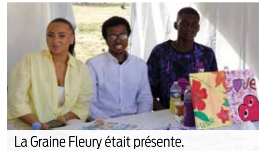
La Graine Fleury était présente.