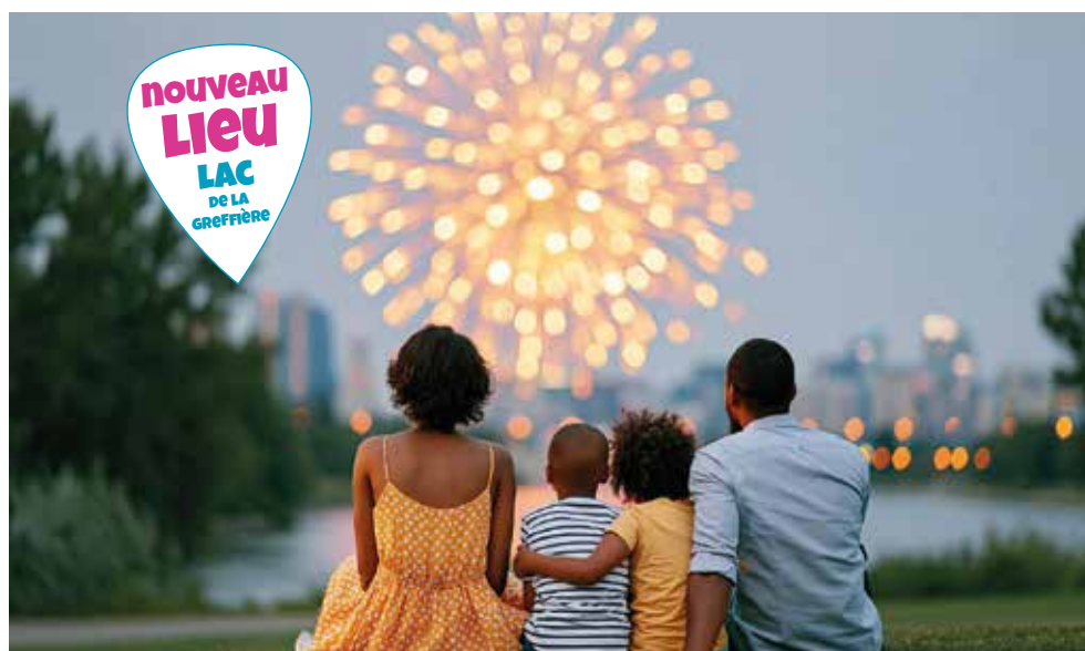
Pour la première fois, le feu d'artifice sera tiré au lac de la Greffière, le 14 juillet.

Une belle soirée d'été en perspective pour célébrer, ensemble, la fête nationale ! ■