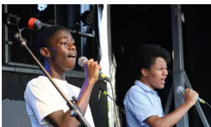
Les élèves du CMA sur la scène.