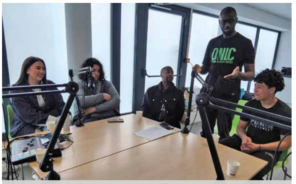
Au micro avec Bouba : les jeunes s'expriment, débattent et partagent.

Au PIJ, à la Maison Angela-Davis et au Chalet (espace Daquin), les jeunes ont participé à des temps d'échange riches et constructifs, où chacun a pu exprimer ses idées, partager son point de vue et débattre de sujets qui les touchent au quotidien. ■