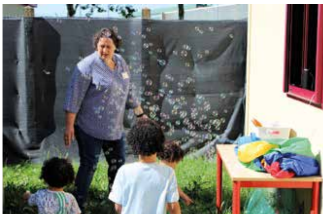
Le RPE, un lieu de rencontre pour les tout-petits.

Le Forum des assistantes maternelles indépendantes, qui s'est tenu le 13 juin, a favorisé de belles rencontres et des échanges entre professionnelles et parents.