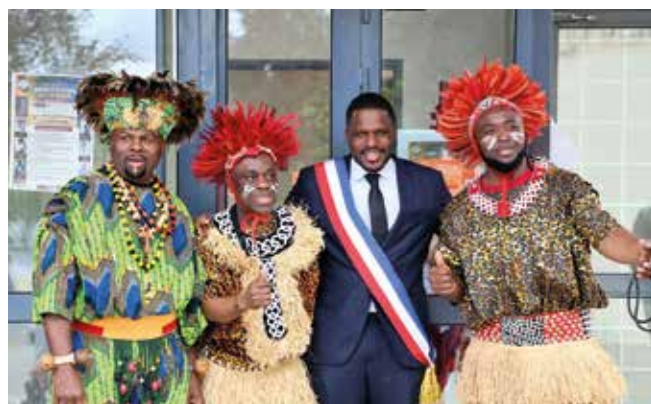
Des artistes de talent salués par M. le Maire.

rencontrer des talents venus de divers horizons (écrivains, danseurs, musiciens, conteurs...). Merci à tous, bénévoles, artistes et agents municipaux pour cette magnifique édition. ■