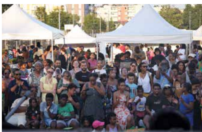
Un public conquis à la Coulée Verte.