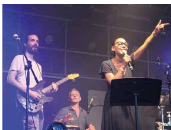
Just L : juste sensationnel !