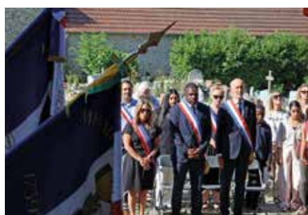
Tous observent une minute de silence.