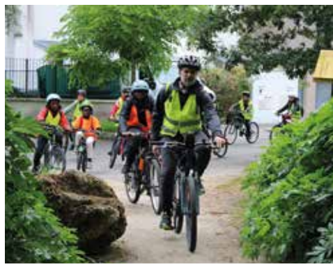
En route pour une belle aventure !