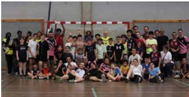
Rendez-vous en septembre avec le club de handball.