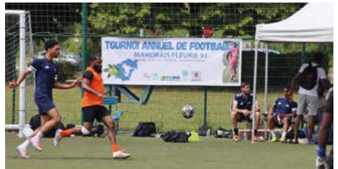
Le tournoi des Mahorais aura lieu le 4 juillet.