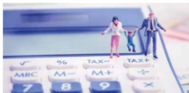
N'oubliez pas de faire calculer votre quotient familial!

Les documents peuvent être transmis en mairie (service Régie) ou par mail à regie@mairie-fleury-merogis.fr . Après le 30 septembre 2026, le tarif maximum sera appliqué. Dépêchez-vous! ■