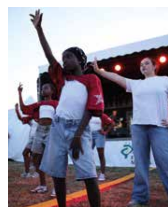
De la danse avec DCK School.