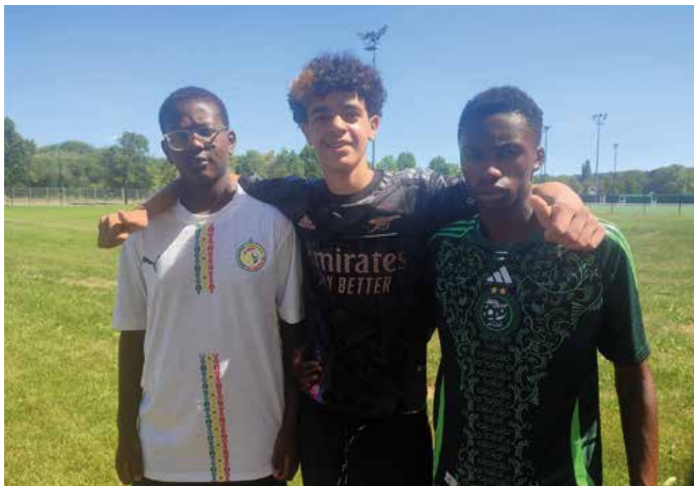
Des collégiens aujourd'hui en attente des résultats du brevet des collèges.

Aujourd'hui, les jeunes candidats n'ont plus qu'à patienter. Bon courage aux futurs lycéens dans l'attente des résultats du brevet, prévus le 9 juillet à 14 heures. ■