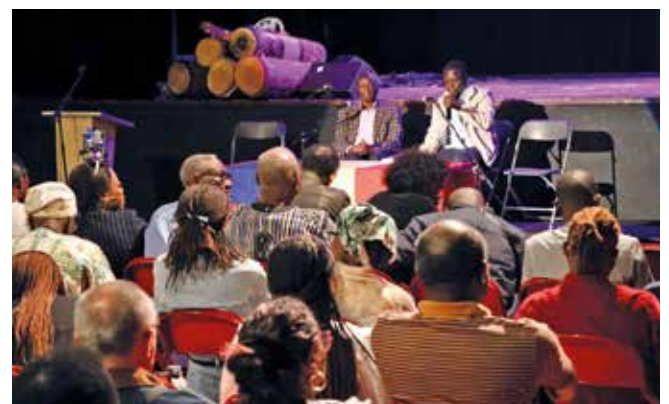
De 14h à minuit, le plein d'animations culturelles.