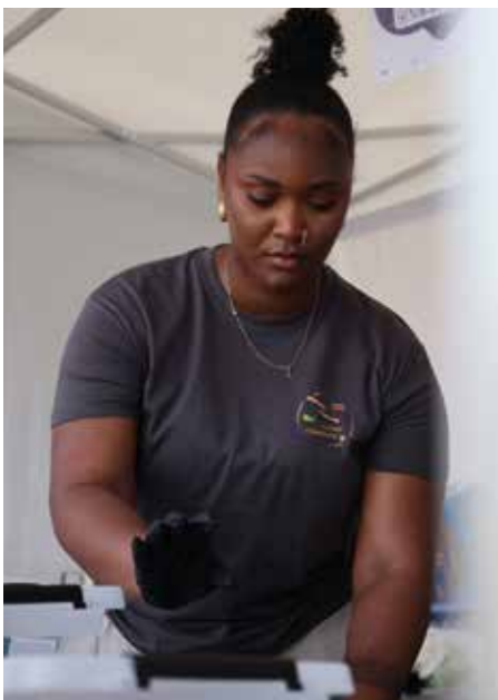
Avec Cyro Miel Connexion...