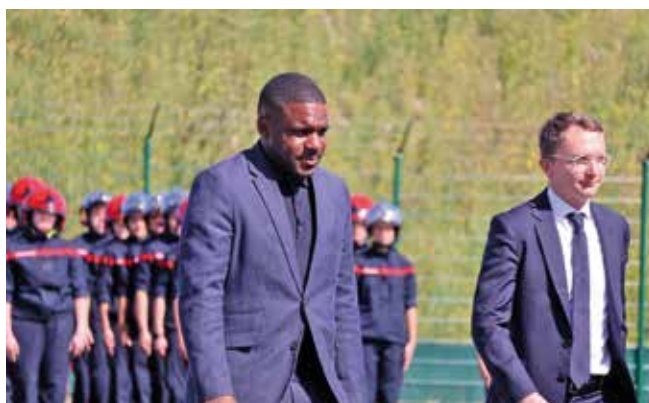
Hommage à celles et ceux qui veillent sur notre sécurité.

des sapeurs-pompiers à l'ÉDIS de Fleury-Mérogis. Il a salué l'engagement, le courage et le dévouement des sapeurs-pompiers au service de notre sécurité, et adressé ses félicitations aux personnels distingués lors de cette cérémonie. ■