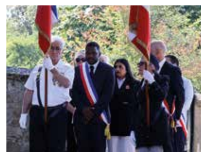
Les porte-drapeaux à l'honneur.