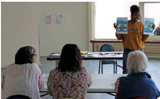
À la recherche de précieux conseils.

«Pratiquer une activité physique en sécurité avec son diabète». Des questions, de précieuses réponses. Animées par les bénévoles de l'association, rejointes