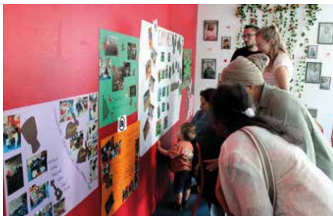
Découvrir les lieux à travers l'exposition.