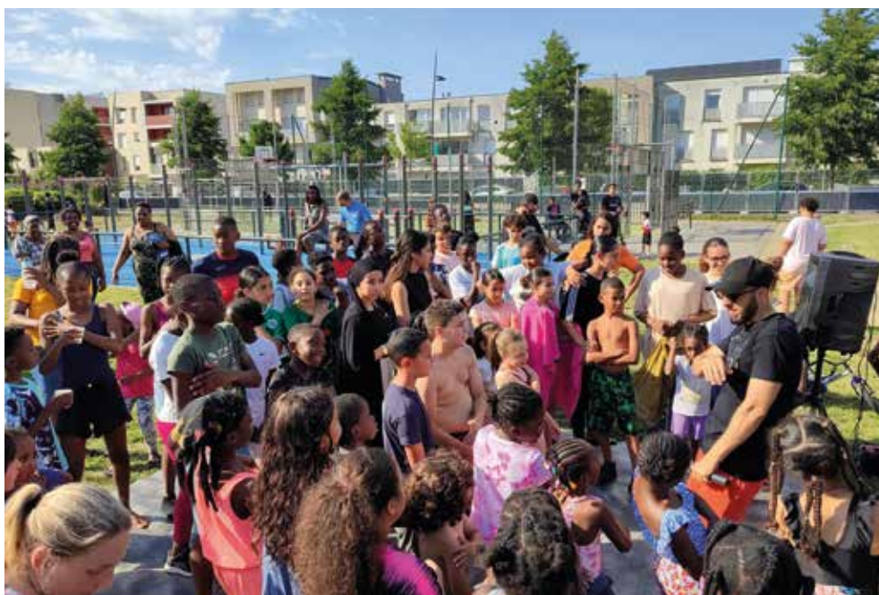
Aux Aunettes, au Village ou aux Résidences, « on a hâte d'y être ! »

Cet été, les quartiers s'animent ! En juillet et août, retrouvez de nombreux rendez-vous et temps de convivialité près de chez vous (fête foraine, fête nationale, quartiers d'été...) ou en sorties (culturelles, à la mer...). Des moments à partager, des découvertes à vivre et de belles occasions de profiter de la saison estivale. Vive l'été à Fleury-Mérogis !