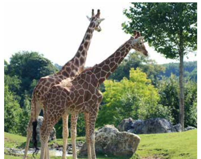
Évasion au zoo de Beauval le 16 juillet.