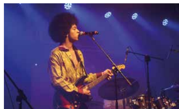
Lemmy's tribes jouait en première partie.