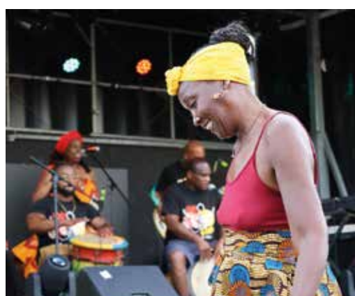
Bwa Bandé a mis l'ambiance.