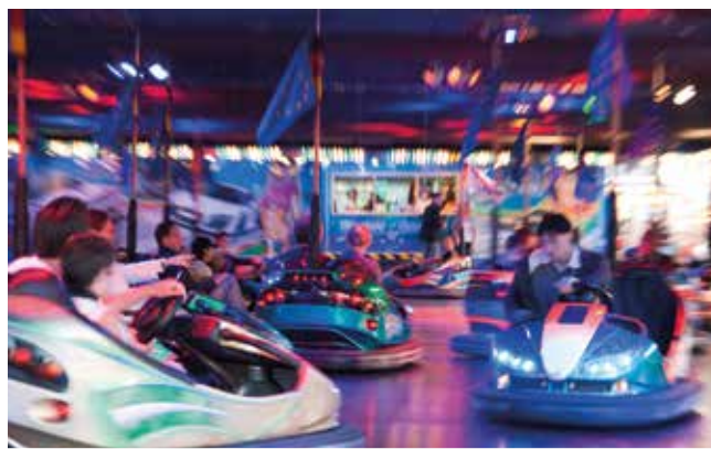
...autos-tamponneuses pour les plus grands.

Du 4 au 19 juillet, la fête foraine prend ses quartiers à la Pointe Verte. Manèges, attractions, journées promotionnelles et nocturne du 14 juillet rythmeront ce rendez-vous du début de l'été.