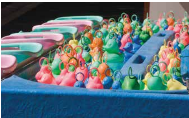
Pêche à la ligne pour les petits...