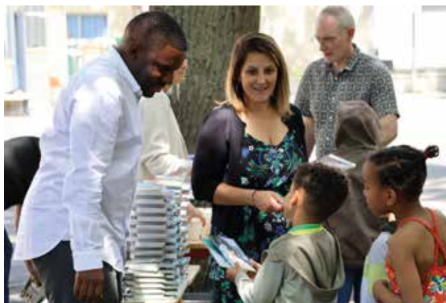
Remise des livres et des calculatrices (ici, à Curie).