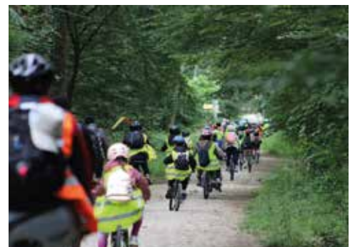
Les enfants de Desnos s'engouffrent dans le bois...