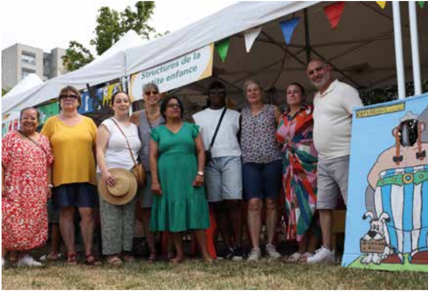
Les élus ont rendu visite à l'équipe de la petite enfance.