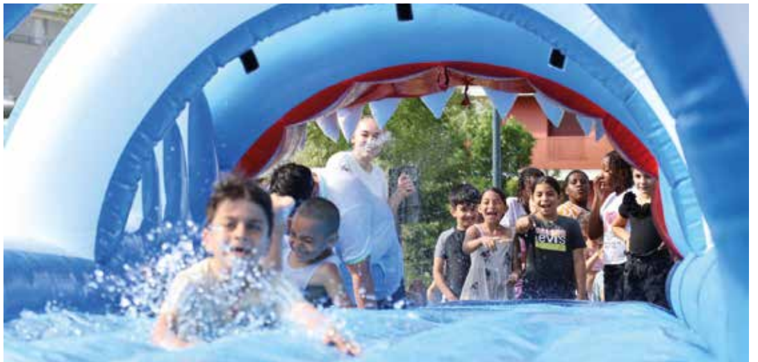
Glissades et éclats de rire tout l'après-midi !